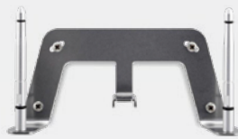
Kit de montage mural S30853-H4030-R101